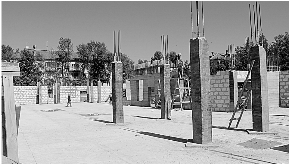
Обстановка на стройплощадке в начале июня

Из федерального бюджета на строительство выделяется субсидия в размере 49,897 тысячи рублей, по 25 миллионов рублей предусмотрено в областном и муниципальном бюджетах. Предыдущим подрядчиком было освоено лишь четыре с половиной миллиона рублей. Оставшаяся сумма «переброшена» новому застройщику.